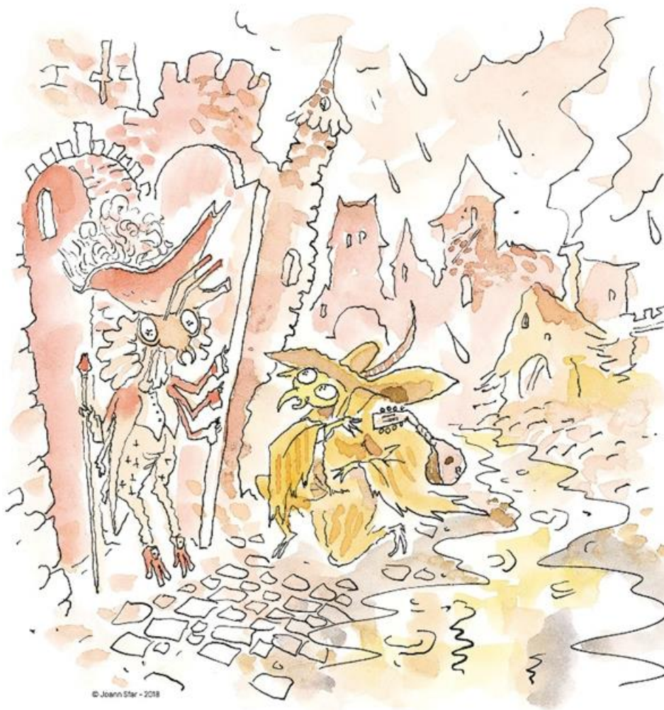
Illustration de Joann Sfar