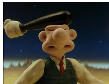
Planche thématique Le burlesque

Wallace est à la fois ingénieur et gaffeur (rappelle la figure de Buster Keaton). Situations cocasses, incongrues qui rythment le film.