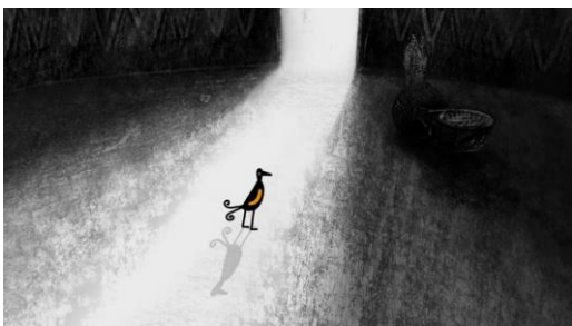
Planche thématique Les traces, liens dedans/dehors

Dans Flocon de neige , quand le petit garçon se réveille, un oiseau est près de lui et ressemble fortement à celui de son rêve. Lorsqu'il sort, il croit voir un reste de neige qui fond aussitôt. A-t-il vraiment rêvé ? Les traces sèment le doute.