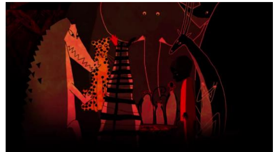
Planche thématique Eloge des plaisirs simples

Dans Flocon de neige , le petit garçon peut se rouler dans la neige pour son plus grand plaisir. Il part à la rencontre de la neige qu'il ne connaît pas et rencontre au fur et à mesure de nombreux animaux de la savane . À la fin, ils viennent tous se réchauffer chez lui. Il n'est plus seul et s'est constitué une petite communauté. Le plaisir de la neige se transforme en plaisir d'être ensemble .