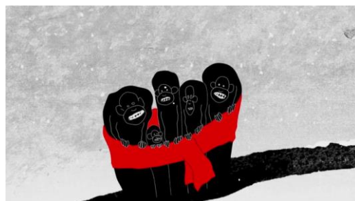
Planche thématique Le voyage

Dans Flocon de neige , le danger réside principalement par le froid qui règne sur la savane et dont les animaux n'ont pas l'habitude.