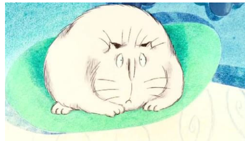
Planche thématique Les personnages