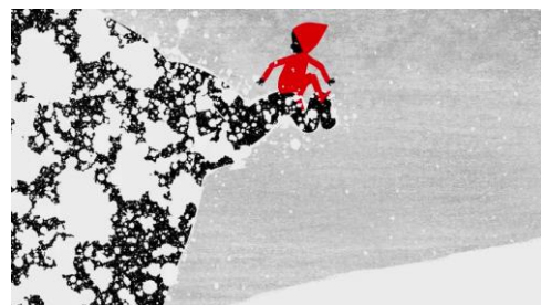
Planche thématique Cadrage et axes de prises de vue

Dimension esthétique , quasi- abstraite parfois.