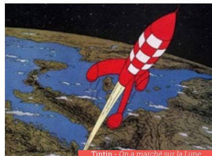
Tintin - On a marché sur la Lune

* Genre littéraire qui propose d'imaginer comment sera notre monde dans un avenir plus ou moins proche. La caractéristique du roman d'anticipation réside dans sa crédibilité.