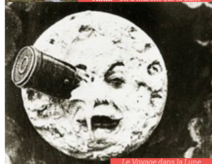
Le Voyage dans la Lune