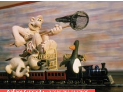
Wallace & Gromit - Un mauvais pantalon