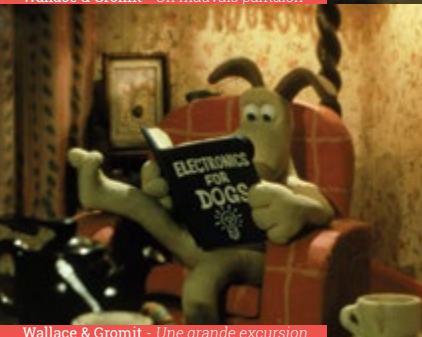
Wallace & Gromit - Une grande excursion

Wallace, inventeur prolifique, est un grand amateur de fromages. Il aspire à une vie tranquille. Affectueux, il n'oublie jamais le 12 février, date de l'anniversaire de son chien Gromit, mais manque parfois de clairvoyance dans le choix de ses cadeaux... et de ses locataires. Débonnaire et casanier, il subit l'aventure plutôt qu'il ne la recherche. C'est un héros malgré lui.