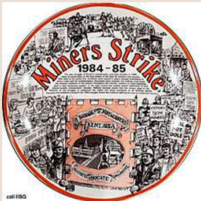
Document 6. Images des grèves de mineurs (1984-1985)