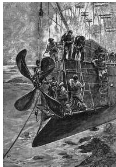
Robur le Conquérant (L. Benett, 1887)