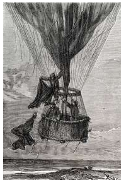
Cinq semaines en ballon (E. Riou, 1863)