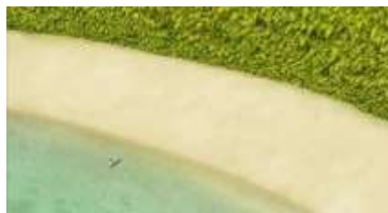
Échecs successifs - 26 -