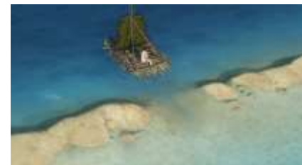
Échecs successifs - 16 -