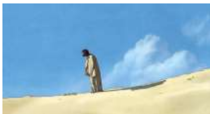
Échecs successifs - 29 -