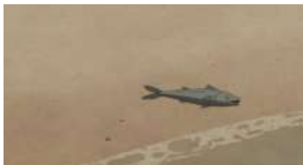
Échecs successifs - 61 -