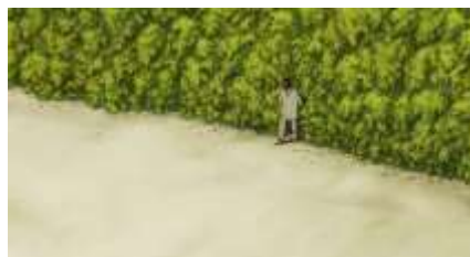
Échecs successifs - 30 -