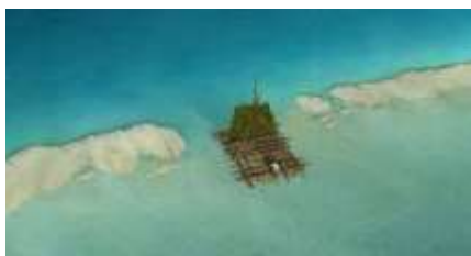
Échecs successifs - 33 -