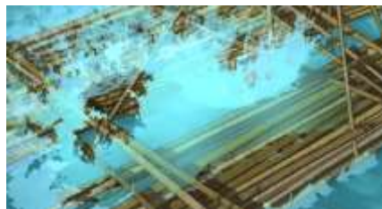
Échecs successifs - 38 -