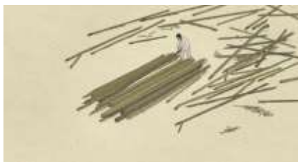
Échecs successifs - 5 -