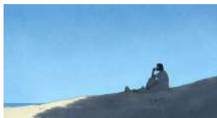
Échecs successifs - 10 -