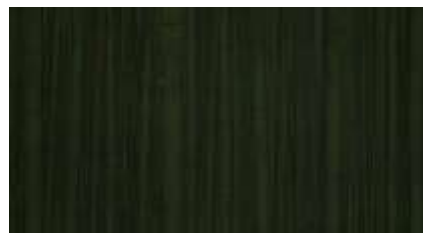
Échecs successifs - 51 -