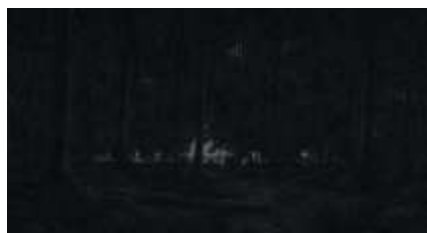
Échecs successifs - 58 -