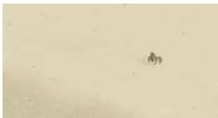
Échecs successifs - 1 -