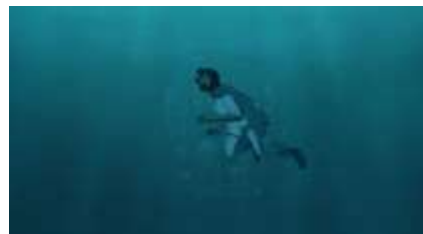
Échecs successifs - 39 -