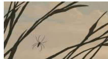
Échecs successifs - 64 -