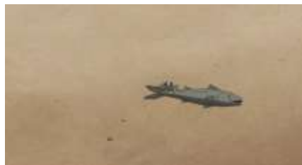
Échecs successifs - 62 -