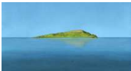
Échecs successifs - 25 -