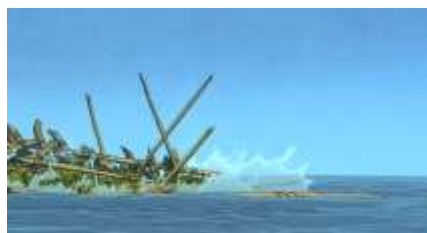
Échecs successifs - 22 -