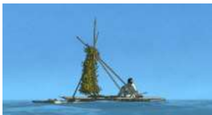
Échecs successifs - 17 -