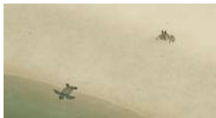
Échecs successifs - 2 -