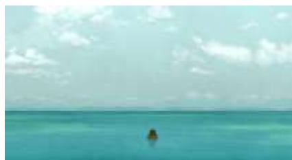
Échecs successifs - 34 -