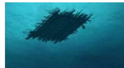
Échecs successifs - 36 -