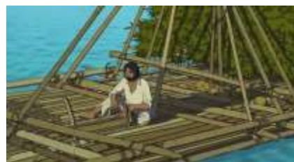
Échecs successifs - 35 -