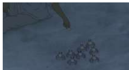
Échecs successifs - 11 -