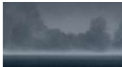
Échecs successifs - 43 -