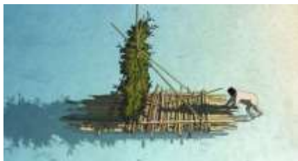
Échecs successifs - 13 -