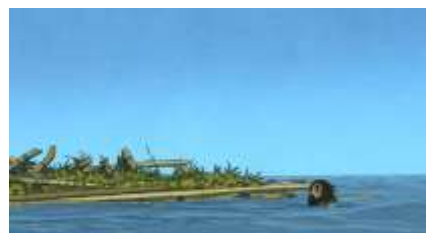
Échecs successifs - 23 -