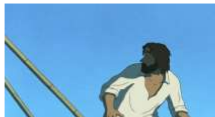
Échecs successifs - 19 -