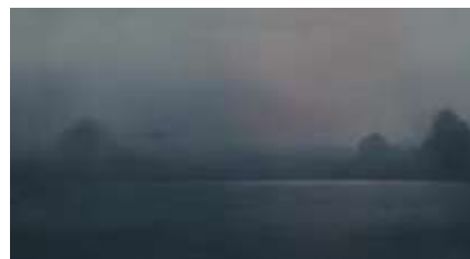
Échecs successifs - 55 -