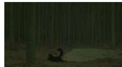
Échecs successifs - 52 -