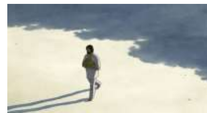
Échecs successifs - 12 -