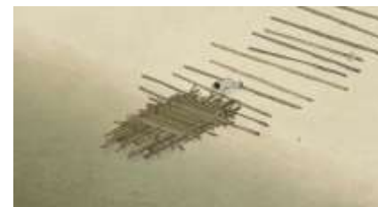
Échecs successifs - 8 -