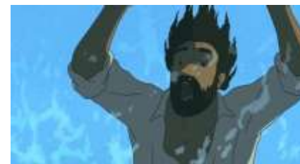
Échecs successifs - 20 -