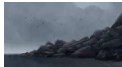
Échecs successifs - 44 -