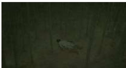
Échecs successifs - 53 -