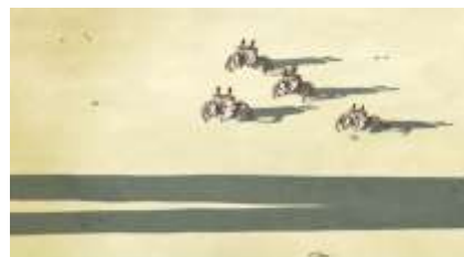
Échecs successifs - 27 -