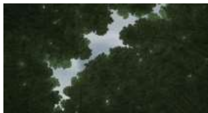
Échecs successifs - 50 -