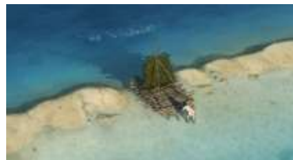
Échecs successifs - 15 -