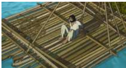
Échecs successifs - 37 -