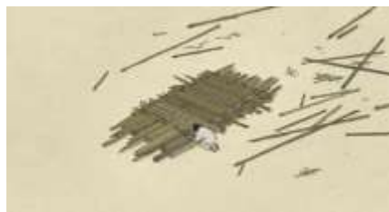
Échecs successifs - 6 -