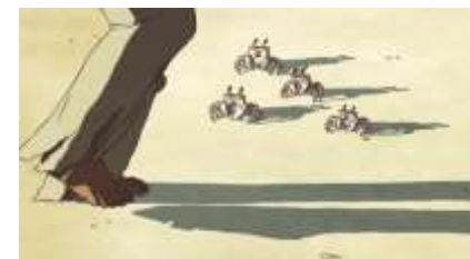
Échecs successifs - 28 -