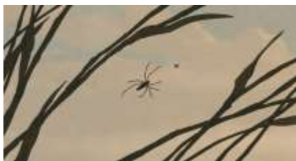
Échecs successifs - 65 -