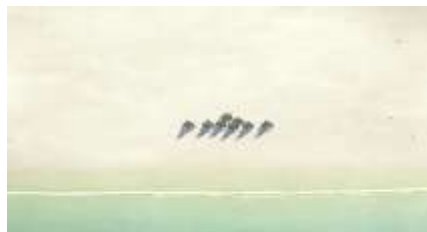
Échecs successifs - 14 -