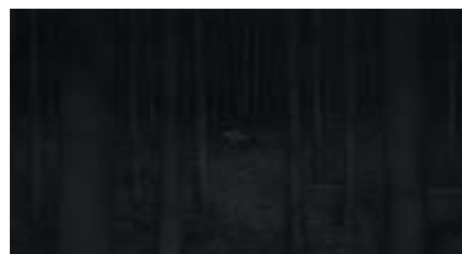
Échecs successifs - 59 -