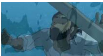
Échecs successifs - 21 -