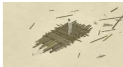
Échecs successifs - 7 -