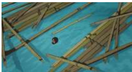
Échecs successifs - 41 -