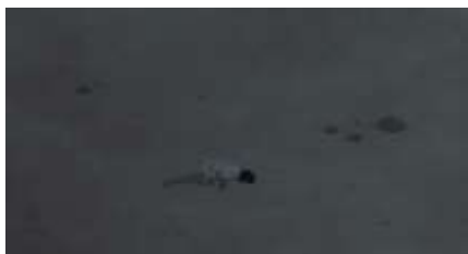
Échecs successifs - 49 -