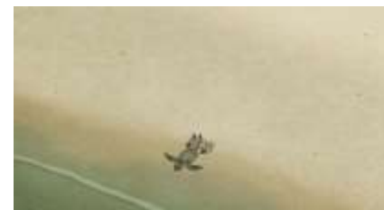
Échecs successifs - 4 -