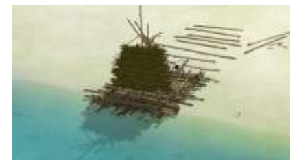
Échecs successifs - 32 -