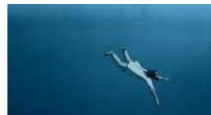
Échecs successifs - 24 -